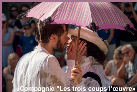
«Compagnie "Les trois coups l'œuvre»

Pour plus d'informations, rendez-vous sur les sites des villes et des Offices de Tourisme.